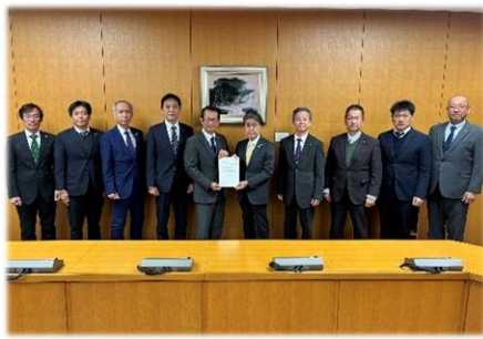
太田市長より、「令和8年度に向けた政策要望」に対する回答をいただきました。