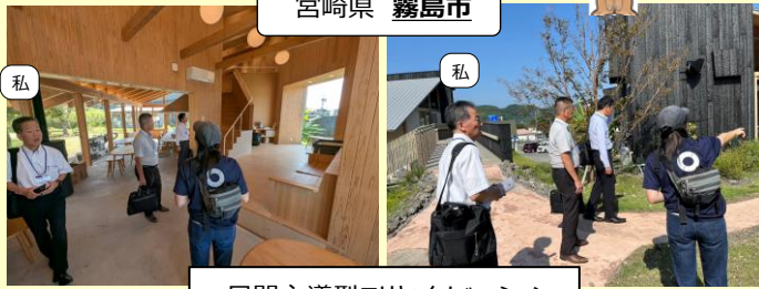
民間主導型エリヤイノベーション