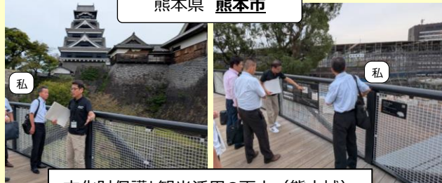
文化財保護と観光活用の両立（熊本城）