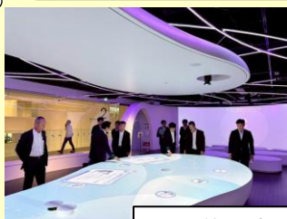
愛知の産業や著名人紹介