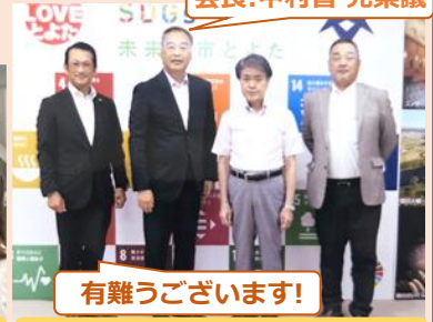
有難うございます!