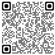
豊田市幹線道路網整備計画2025～2034