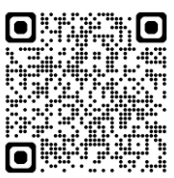
名鉄三河線若林駅付近連続立体交差事業