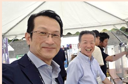
コーポレート支部 合同HUREAI スマイルフェスタ

組合員さんの声を行政に反映させていくように尽力していきます! 今後ご意見をお寄せください!!