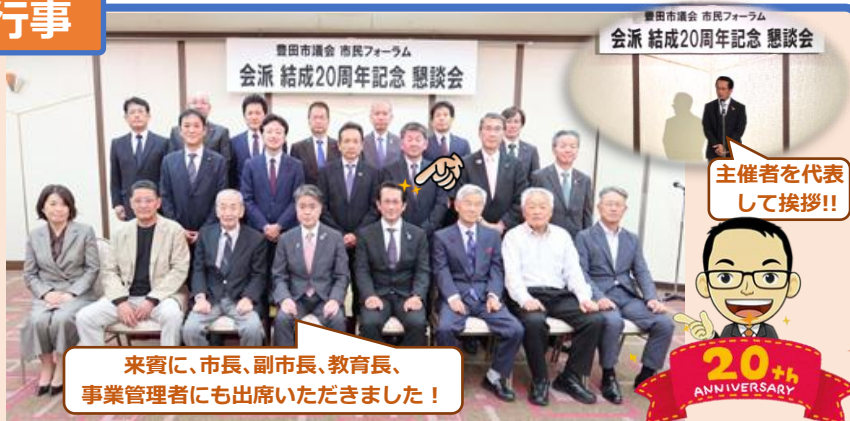
豊田市議会 市民フォーラム 会派 結成20周年記念 懇談会

これからも働くものを代表し豊田市の発展と市民の生活向上を目指して活動していきます!!