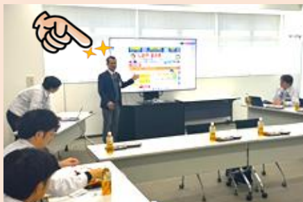
生産・TPS支部 くらしのトーク

課対抗の真剣勝負と各部の工夫を凝らした出し物が魅力的でした! 皆さんの笑顔がとても素敵です!!