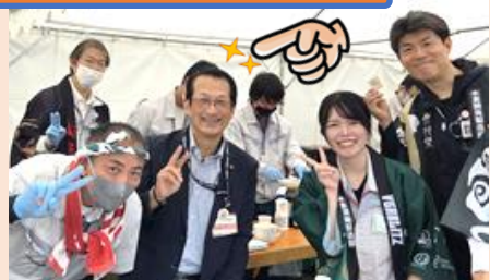
本工支部 駅伝大会

課対抗の真剣勝負と各部の工夫を凝らした出し物が魅力的でした! 皆さんの笑顔がとても素敵です!!