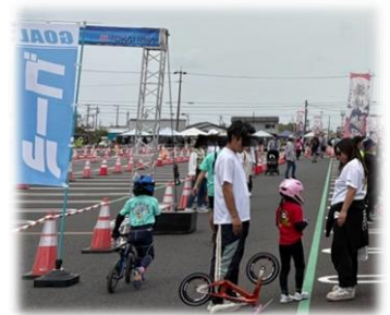
ランバイク全国大会の様子 (株)東海理化駐車場にて

町長 ランバイクを通じてスポーツに携わっていくことも大口町として考えていかなければならない。今後も企業と同じ目的を持ちながら結びつきを強くしていくことが求められている。