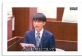
3月定例会 代表質問

新年度を迎え、皆さまにおかれましては、希望に満ちた春をお過ごしのことと存じます。一方で、物価高騰など市民生活を取り巻く環境は依然として厳しく、行政には暮らしの安心を支える継続的な取り組みが求められています。今回の市政レポートでは、先の3月議会の内容を中心にご報告申し上げます。あわせて、会派を代表して行った代表質問の概要についても掲載しておりますので、ぜひご覧ください。