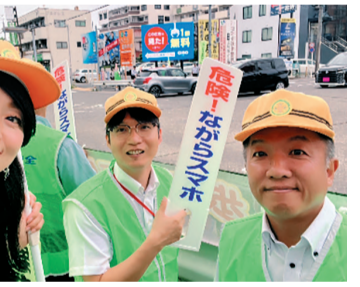
沓名市議、横田市議、守口