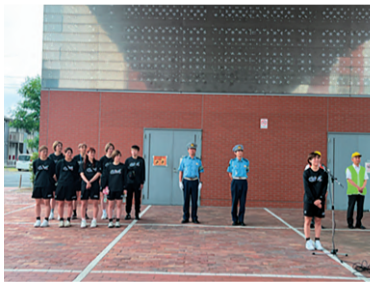
アイシンウィングスと合同実施