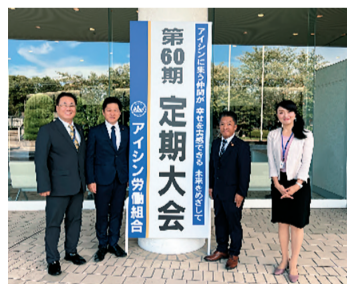
アイシン労働組合定期大会