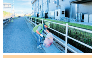
油ヶ淵浄化デーに参加