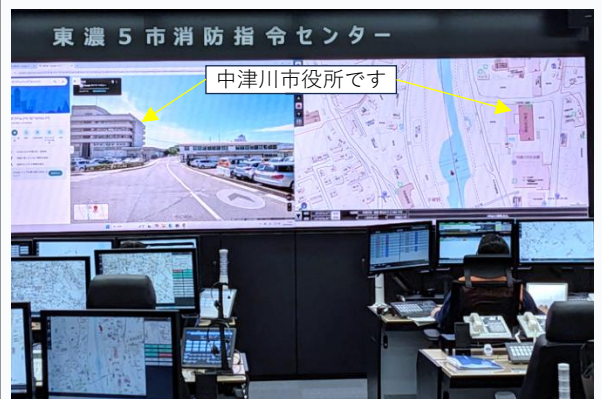
大型画面に映し出された平面図とストリートビュー