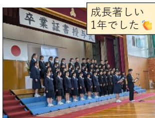
苗木中学校卒業式 (3/6)