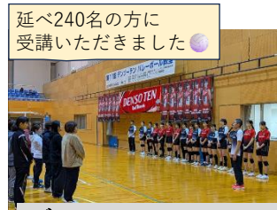
デンソーテン バレーボール教室 (3/14~15)