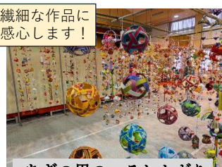
あぎの里のつるしかざり (2/28)