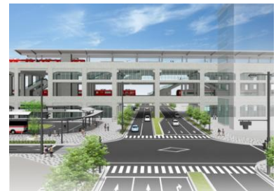
名鉄知立駅完成イメージパース

厳しい寒さの中での選挙戦となっていますが、投票日はもちろんのこと、お忙しい方や寒さが心配な方は、知立市役所で実施されています期日前投票をご活用いただければ幸いです。私たちのまち、そして日本の未来を誰に託すのか。その意思を明確に示すことが、より良い社会を築く確かな力となり得ることを確信しています。