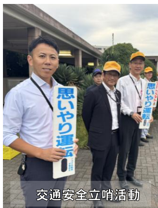
交通安全立哨活動