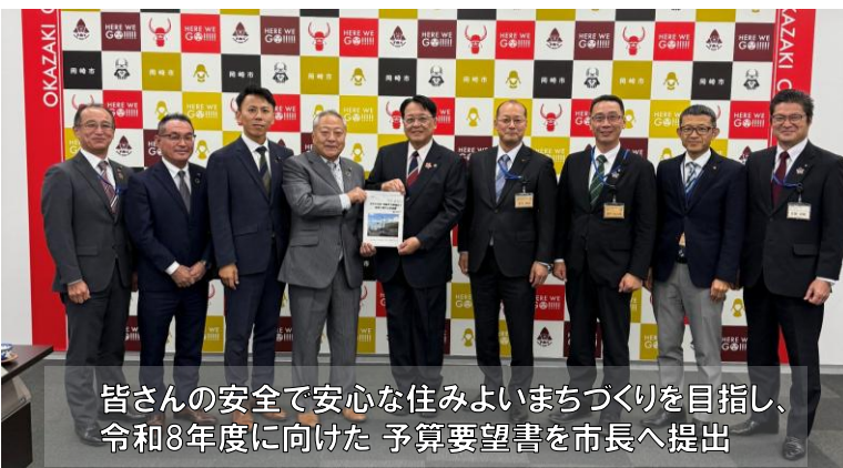
皆さんの安全で安心な住みよいまちづくりを目指し、令和8年度に向けた 予算要望書を市長へ提出