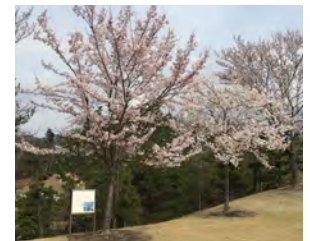
全トヨタ労連研修センターつどの丘