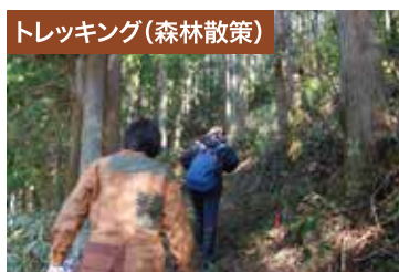
トレッキング(森林散策)