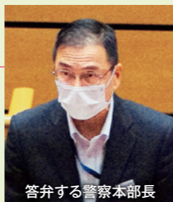
答弁する警察本部長

交通死亡事故抑止の柱の一つとして交差点対策を掲げ、交差点における交通事故の発生状況に応じた取締りのほか、ドライバーの交通安全意識の醸成を図るための交通街頭活動を推進している。そこで、子どもや高齢者が多く利用する施設周辺のほか、自動車と歩行者による交通事故が多発している交差点において、重点的に整備しているところであり、今後も、交通事故の発生状況、自動車や歩行者等の交通量、道路形状等を踏まえた上で、必要な箇所への整備を推進していく。