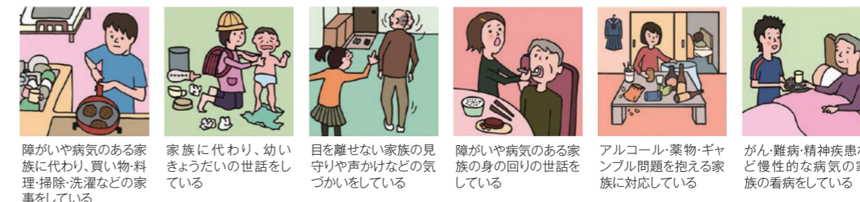
障がいや病気のある家族に代わり、買い物・料理・掃除・洗濯などの家事をしている