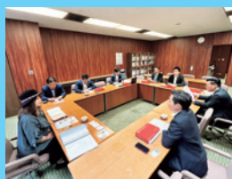
5/22 (一社)SORAより 動物福祉の状況 をヒアリング