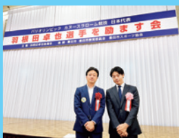
5/8 カヌー日本代表 羽根田卓也選手の 壮行会に出席