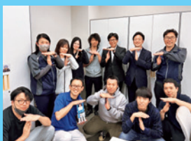
5/14 東久労働組合の 皆さんへ 県政報告