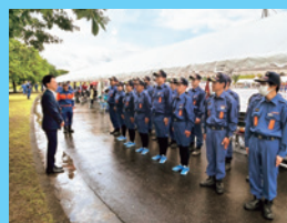
6/2 豊田市消防 操法大会で 地元消防団を激励