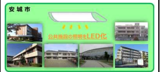
公共施設照明設備 LED 化事業