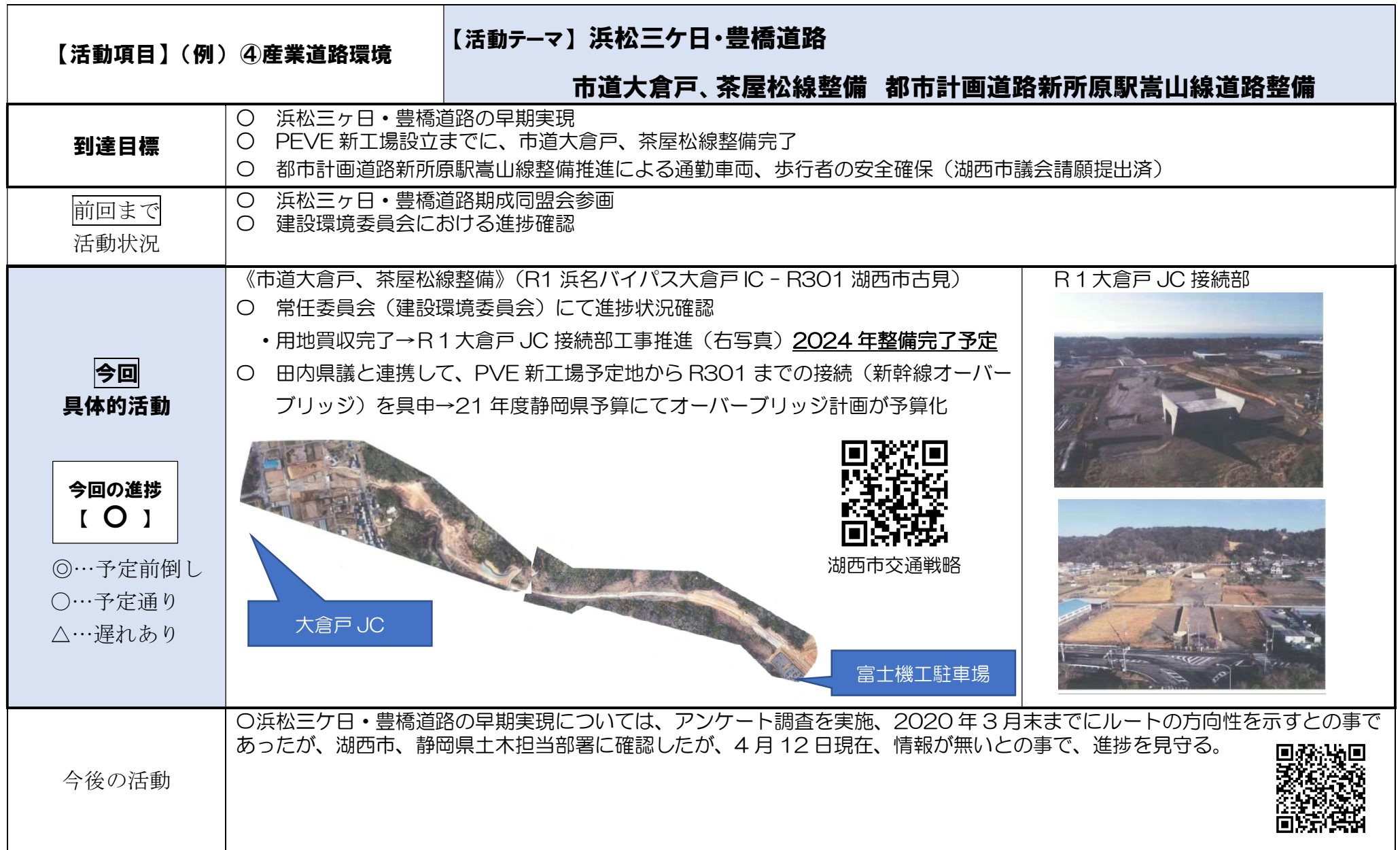
R1 大倉戸 JC 接続部