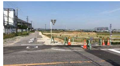
【整備が決定した道路】 (令和3年6月9日撮影)