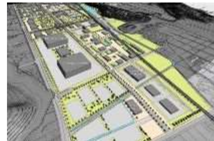
企業誘致イメージ図

APB(株)が駅前へ進出し、将来的には900億円を目標に掲げているその報告のため市長に表敬訪問した記事