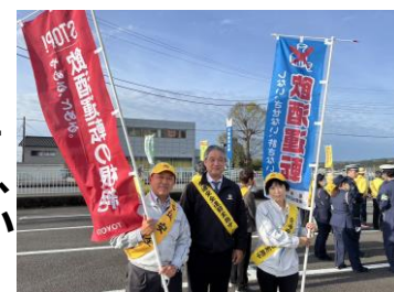
総合センター統括部も参加

4月6日(土)~4月15日(月)の10日間が運動期間ということで8日(月)に新年度を迎える入学したばかりの新1年生や、新しい学年となった児童・生徒が希望を胸に登下校します。道路を通行する際は、心と時間に余裕をもち、安全運転を心がけましょう。という市長のあいさつのもと、裾野警察署、市役所、企業、各団体の中に私(議会)も参加させていただきました。