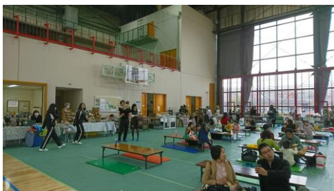
みんなで子育てフェスティバル