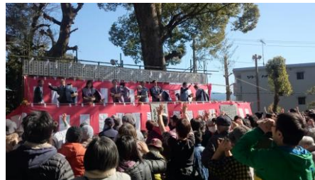
佐野八幡宮節分祭