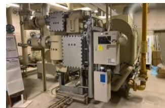
◎令和2年度更新予定 総合体育館空調設備(GHP)