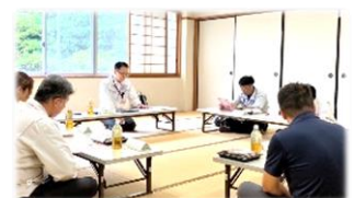
【明知支部】座談会トーク

明知工場の東側、県道234号線（岡崎三好線）にて、歩行出勤者からのご相談です。歩道に雑草が生い茂り、歩行や自転車走行の妨げになってるとご連絡がありました。除草回数は、1～2回/年で計画的に実施していますが、安全に問題があればご連絡をください。