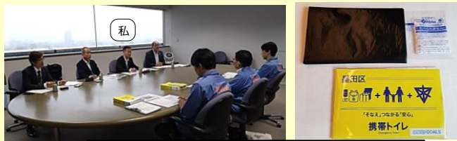
福祉避難所開設訓練等による防災の取組