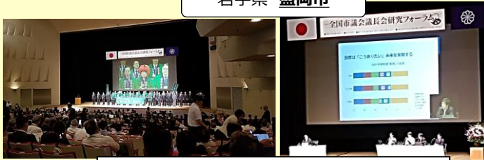
議会活性化のための取組 シンポジウム