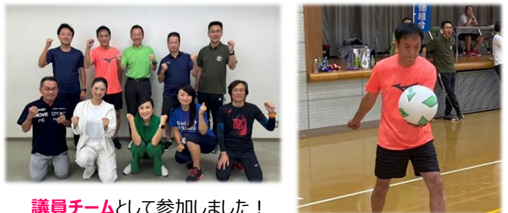
議員チーム として参加しました！