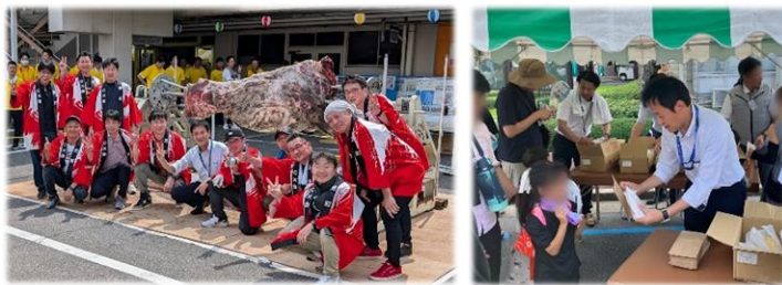
トヨタ労組 元町支部が行った メロンパンの配布 を手伝いました！