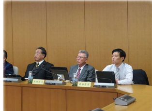
環境福祉委員会として「豊田地域医療センター」の方と医療と先進技術について意見交換をしました！