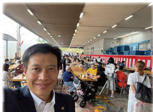
HIROSE FES. 2024(トヨタ紡織広瀬様) NHKニッパツ秋まつり(日本発条様) 日頃ご支援を頂く企業・労組のおまつりにお招きいただきました。皆さんが日頃の労をねぎらい、楽しい時間を過ごされていました！