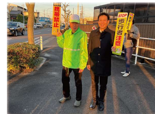
交通安全立哨。心にゆとりをもって運転したいですね。私も交通安全を心がけます！