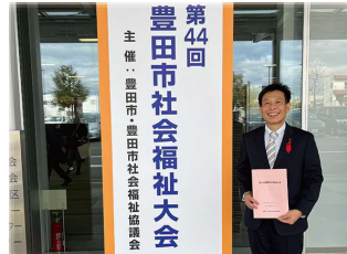
社会福祉活動に貢献された方々を検証する「豊田市社会福祉大会」に参加。尊い活動に経緯を表します！