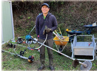
休日のボランティアにも楽しく参加しています。草刈り機の扱いも上達してきました！