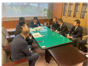
会派活動として、国の各省庁に対し、豊田市の産業振興や道路整備について要望をしております！