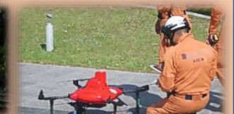
消防用ドローン 救助用ボート