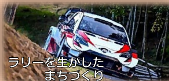
ラリーを生かしたまちづくり