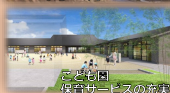
こども園 保育サービスの充実