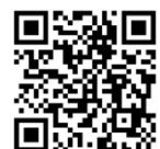
つくラッセルとは?

都心部に出なくても働ける環境整備、旭地区の「つくラッセル」でのテレワーク・サテライトオフィスを含めた新たな雇用創出の手法を検討。