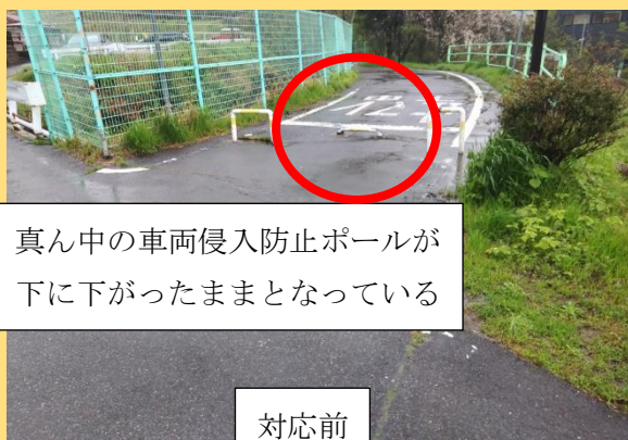
真ん中の車両侵入防止ポールが下に下がったままとなっている

【対応内容】担当部署に相談し、車両侵入防止ポールの修正を行って頂き、自転車で通行時に安全に通行できるようになりました。