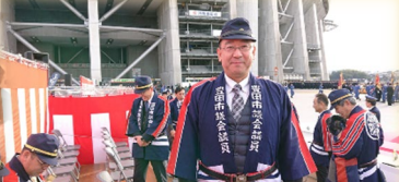
令和2年豊田市消防出初式 きびきびとした消防訓練に 感動致しました。