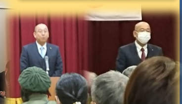
各自治区総会 各自治区の総会に参加し、 あいさつをさせていただきました。