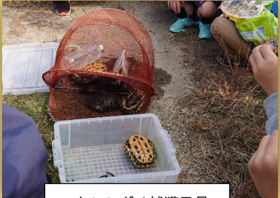
アカミミガメ捕獲風景

A. 地域住民と事業者の共働でアカミミガメ防除プロジェクトのモデル事業を実施。 元々ペットとして飼育されていたものが捨てられて増加し、在来種であるイシガメやスッポンなどの餌や生息場所を奪うことが懸念されている。今後は、 モデル事業にて作成した「アカミミガメ防除マニュアル」 をもとに、 地域の防除活動を更に拡大していきたい。