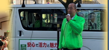
市長選挙応援演説 市駅前等、様々な場所にて 応援演説をしました。