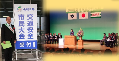
交通安全市民大会 「交通事故は絶対おこさない・ おこさせない」と改めて感じました。