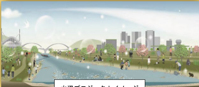
水辺プロジェクトイメージ