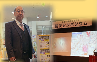
自治区防災シンポジウム まず、自分の身は自分で守る。 日頃からの備えが重要です。