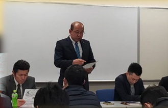
豊田地協幹事会 私の活動報告並びに、豊田市 の近況報告を実施しました。