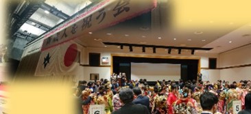
自治区新成人を祝う会 来賓を代表して、あいさつを させていただきました。