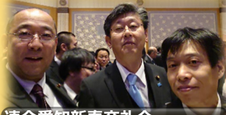
連合愛知新春交礼会 議員として初めて参加させていただきました。

様々な活動に参加させていただきました。 市民の皆様の防犯・防災に注力してまいります