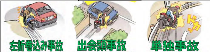
バイク事故の特徴