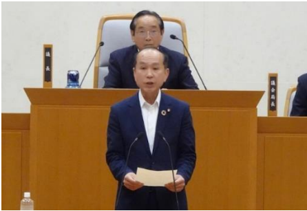
副議長退任あいさつ