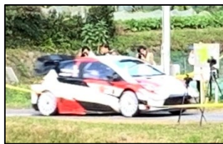
2019年11月下山テストラリー

自動車文化の醸成と産業の振興を図るため、ラリーの開催支援と地域振興につながるイベントを実施します。