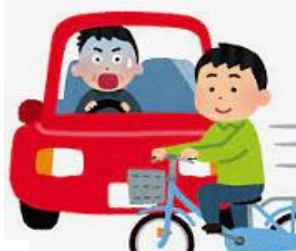
自転車乗用中の交通事故死傷者数 (人口1万人当たり)