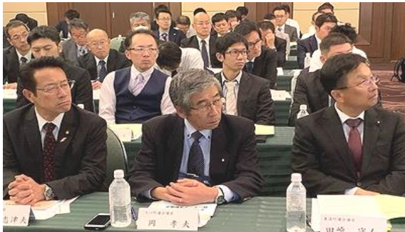
11/4 (月) 全ト政推連総会・政策勉強会(名古屋市内)