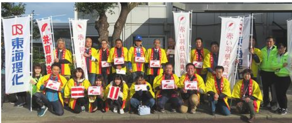
11/17 (日) 赤い羽根共同募金ハトフリデー 社協の皆さんと(東海理化リレーマラソンで)