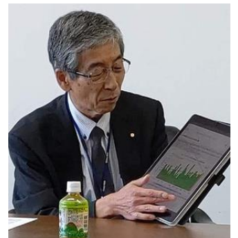
12/4 (水) 尾北ライン議員勉強会(犬山市役所)