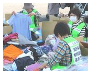
に選別、箱詰めしていきます