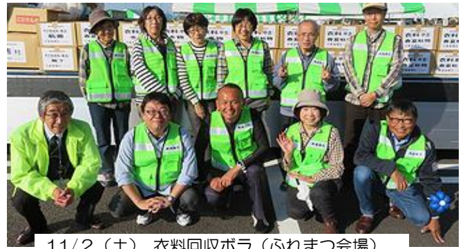
11/2 (土) 衣料回収ボラ(ふれまつ会場) [ 議会ブースのクイズと掛け持ちでした～ ]