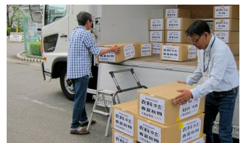
春夏秋物と冬物、新品と中古などに分けて箱詰めし、トラックへ積み込みます