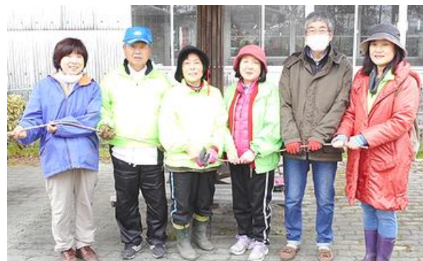
育樹ボラ (Genki 森もりさんと 中小口4丁目 地内 尾張広域緑道)