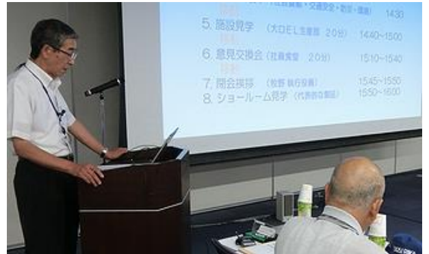
地域の代表の方々をお迎えして (地域懇談会 理化)