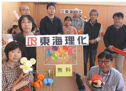
カミさんとバルーンアートボラのお手伝い (児童センターまつり)