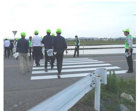
理化 地域美化活動 (R155)