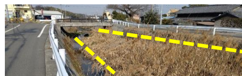
▲ 須賀川 藤川橋下流

県と情報共有し対策を実施し、県に対し未整備区間の早期完成を引き続き要望していく。