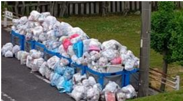
▲ごみステーションの実態