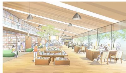
北街区図書館のイメージ