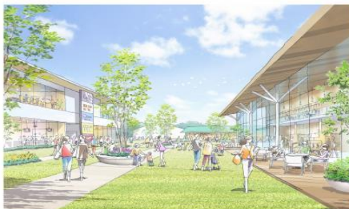
北街区商業施設と休憩施設のイメージ