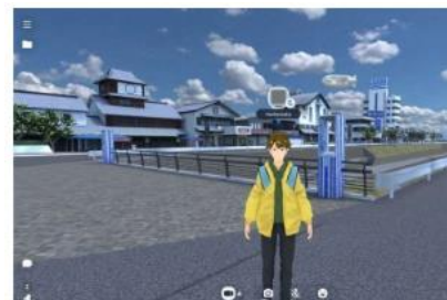
バーチャル仮想空間【イメージ画像】…② 直接のコミュニケーションが難しい児童生徒に対して、気軽に相談できる場を提供