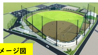
大府市民球場完成イメージ図

その他、議会での議案等の審議結果については、大府市公式ウェブサイトに掲載しています。参照ください。