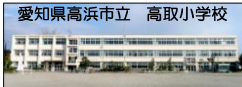
愛知県高浜市立 高取小学校