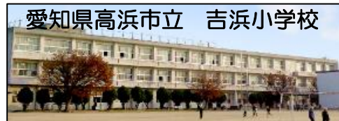
愛知県高浜市立 吉浜小学校