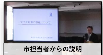
市担当者からの説明