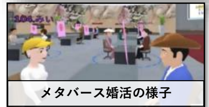
メタバース婚活の様子