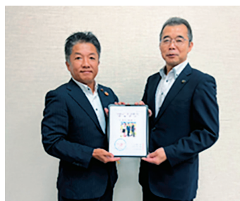
令和8年度会派政策要望書提出と重点施策説明