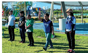
油ヶ淵浄化デーに参加