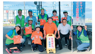
ボランティア23清掃活動