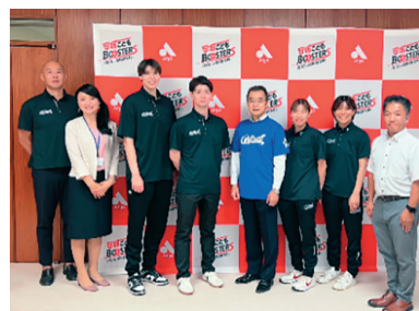
アイシンウィングス表敬訪問