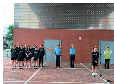
アイシンウィングスと合同実施