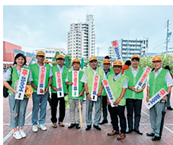
省名市議、横田市議、守口