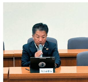
アイシン労働組合定期大会