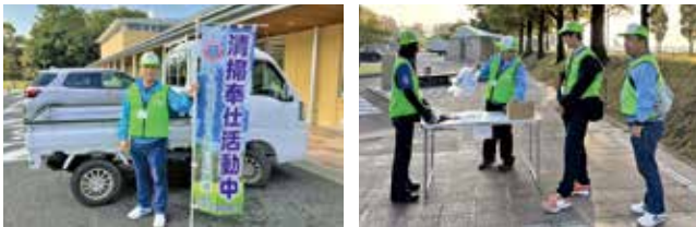
ごみ拾いウォークラリー 10月28日（土）