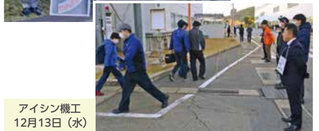
アイシン機工 12月13日（水）