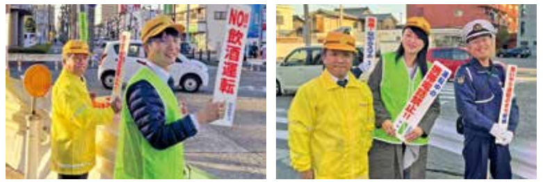
会派メンバーと参加 12月8日（金）

年末の交通安全市民運動（12月1日～10日）に合わせ、交通安全意識の高揚のため実施。三星市長や安城警察署長等のメンバーが、交通事故「ゼロ」に見立てたドーナツをドライバーに手渡し、交通事故ゼロを呼び掛けました。年末に向けて日没時間が早くなり、夕方から夜間の時間帯は特に交通事故の発生が増加します。交通ルールを守り、安全運転を心がけ、交通事故ゼロを目指しましょう。