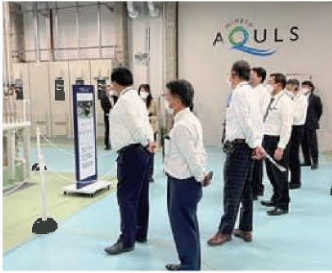
脱炭素先行地域「東邦ガスみなとアクルス」視察 11/4(金)