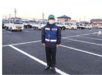
青色パトロール出発式 12/13(火)