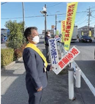
新三商事(株)での交通安全立哨 11/10(木)