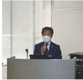
愛三工業労働組合政治勉強会 11/12(土)