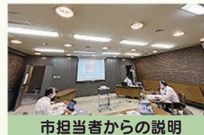
市担当者からの説明