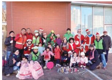
安城さわやかゴミ拾いウォーキング 12/18(日)