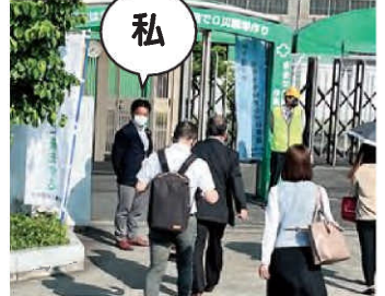
挨拶活動(豊臣機工) 6/21(火)