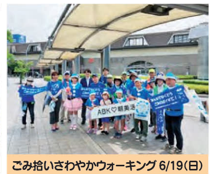
ごみ拾いさわやかウォーキング 6/19(日)