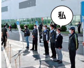
挨拶活動(アイシン機工) 6/1(水)