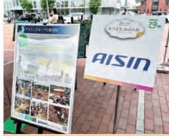
あつまれ ねばの森 (アンフォーレ) 6/11(土)