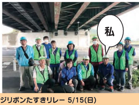
オレンジリボンたすきリレー 5/15(日)