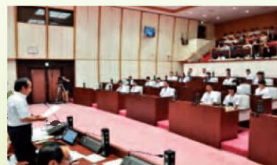
前回の中学生議会の様子

● 開催日…令和4年8月9日(火) 午前9時～ ● 場所…市議会議場(市役所北庁舎6階)他