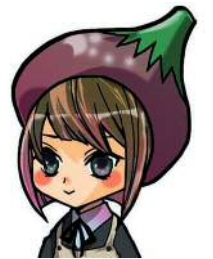
▲安城市図書情報館キャラクターあんず