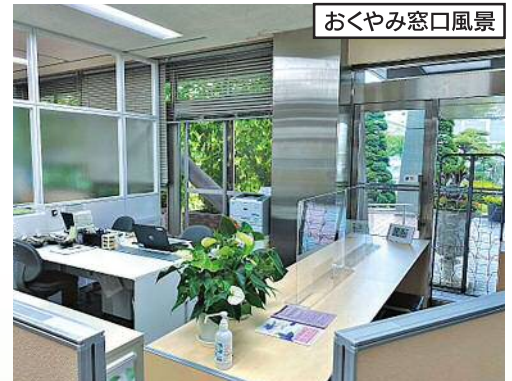
おくやみ窓口風景

備考:死亡届を提出することに伴う健康保険や税金、年金など必要事務手続きは、最大で16課、44種類にわたる。2日がかかりで手続きを終えた人もいます。