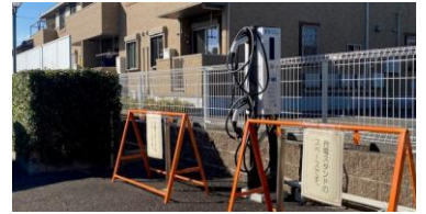
【図書館本館駐車場】