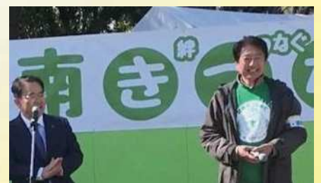
第1回碧南きづなあぐを企画・開催 〔3月10日〕