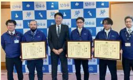
文部科学大臣賞受賞者の表敬訪問 〔1月23日〕