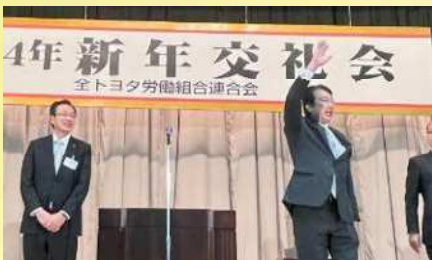
全トヨタ労連の新年交礼会で挨拶 〔1月8日〕