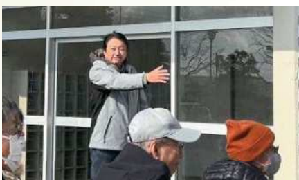
中央小学校で避難所開設訓練を運営 〔3月9日〕