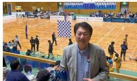
アイシンティルマーレのホームゲーム観戦 〔3月9日〕