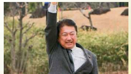
へきなんキッズクロカンに来賓参加 〔2月18日〕