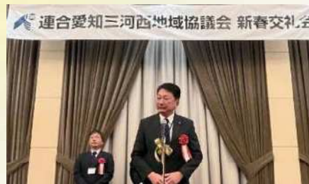
三河西地協の新春交礼会で挨拶 〔1月16日〕