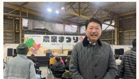
JA あいち中央の農業まつりに参加 〔1月21日〕