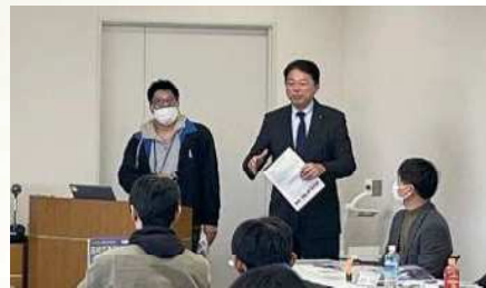
アイシン辰栄労組の研修会で市政報告 〔1月27日〕