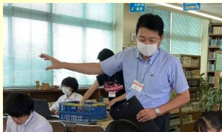
碧南工科高校 FMB プロジェクトを運営