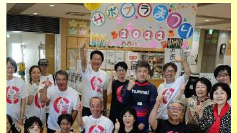
市と共催したサボラまつりを運営