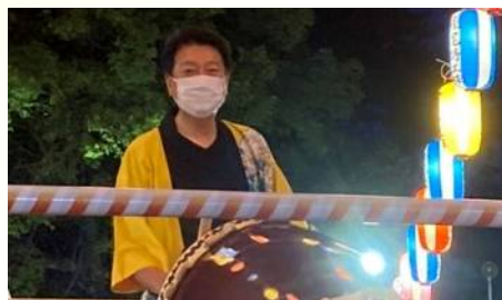
中山地区が主催する夏まつりに参加