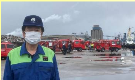
衣浦港消防防災訓練に参加