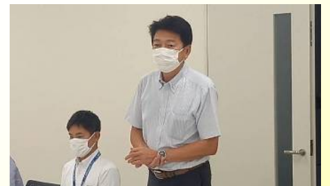
アイシン辰栄労組評議員会で市政報告