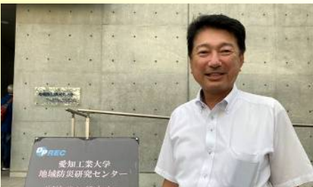
愛工大地域防災センターを視察