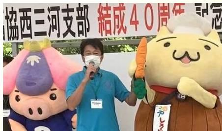
労福協西三河支部記念イベントに参加