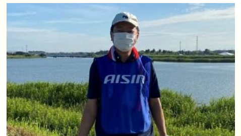
県が主催する油ヶ淵浄化デーに参加