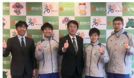
アイシンバレー部と市長表敬訪問 〔1月10日〕