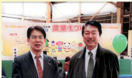
JA あいち中央の農業まつりに参加 〔1月18日〕