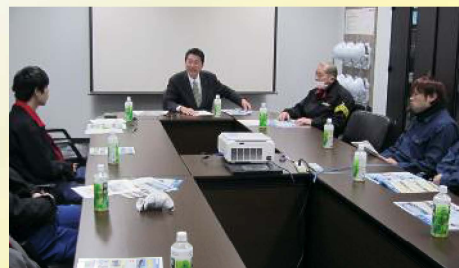
労働組合の地域生活懇談会に出席 〔2月25日〕