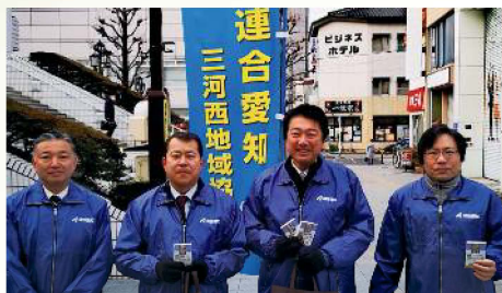
連合愛知三河西地協の街頭活動参加 〔2月12日〕