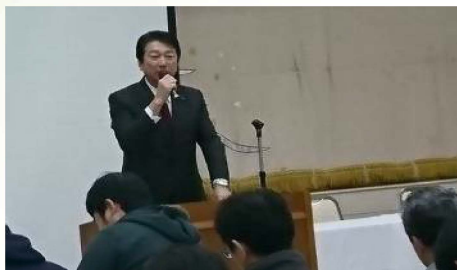
労働組合研修会で活動報告を実施 〔1月24日〕