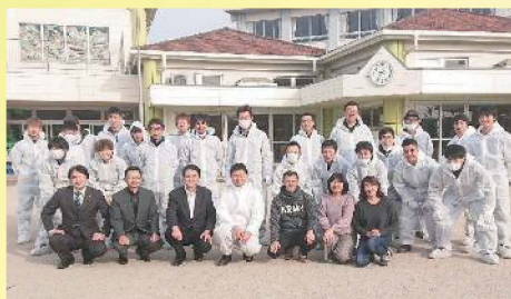
アイシン辰栄労働組合地域貢献活動 〔12月21日〕