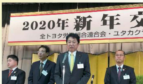
全トヨタ労働組合連合会・ユタカク 2020年新年交 〔1月7日〕