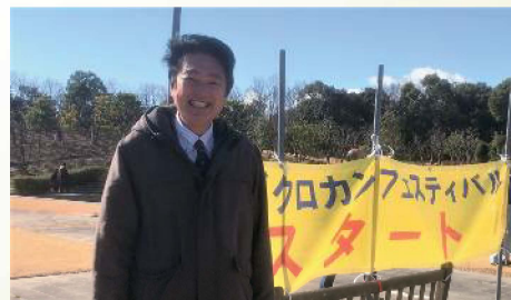
へきなんキッズクロカンで来賓出席 〔2月9日〕