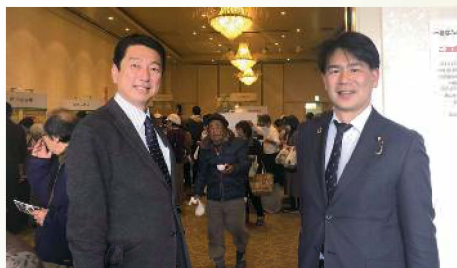
商工会議所主催のへきなん食フェア 〔2月23日〕