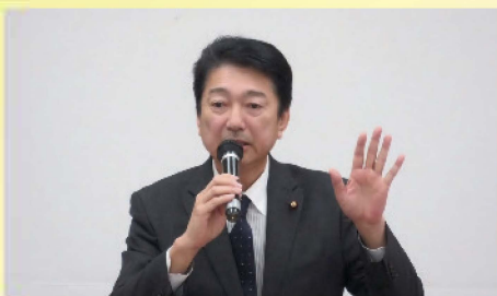
アイシン精機労働組合で活動報告 〔1月26日〕