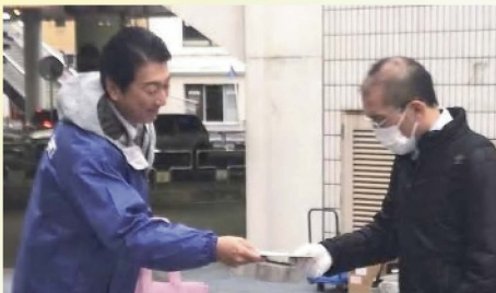
連合愛知の街頭活動に参加 〔2月6日〕