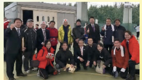
碧南市民駅伝に市議会チーム初参加 〔3月3日〕