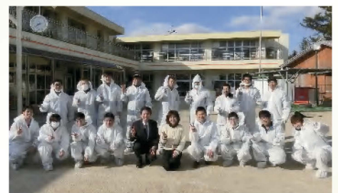
アイシン辰栄労働組合地域貢献活動 〔2月2日〕