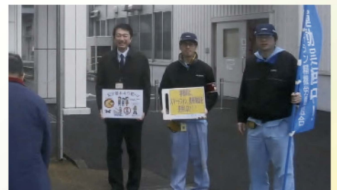
アイシン半田電子の挨拶活動に参加 〔2月20日〕