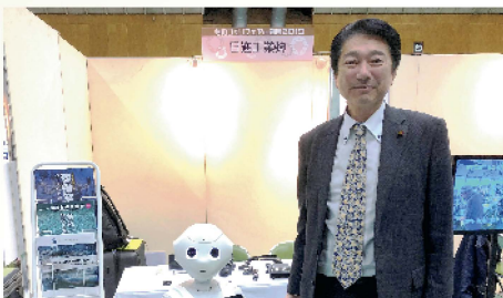
ものづくりフェアin 碧南を視察 〔2月22日〕