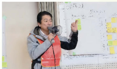
新川地区避難所開設運営訓練に参画 〔2月23日〕