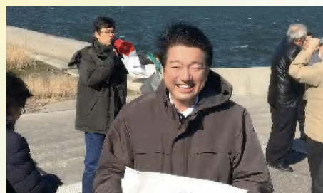
スケートボードパーク整備予定地を視察 〔1月29日〕