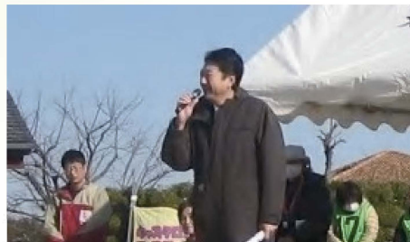
へきなんキッズクロカンで挨拶 〔2月10日〕