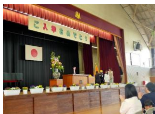
8(火) 知立西小学校入学式