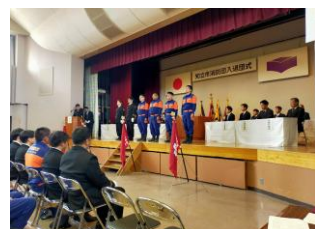
6(日) 知立市消防団入隊団式