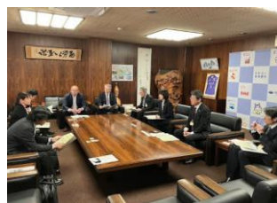
8(火) 三河西地協政策要望確認会