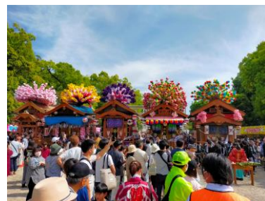
知立まつりの写真(一昨年撮影)