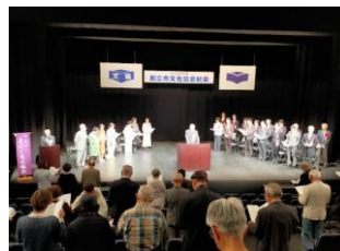
19(土) 知立市文化協会総会