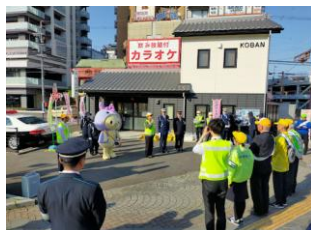
14(月) 踏切事故防止キャンペーン