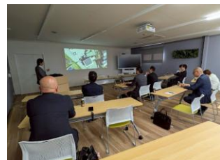
9(水) ユタカクラブ議員研修