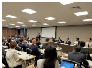
20(日) 全ト政策推進議員情報交換会